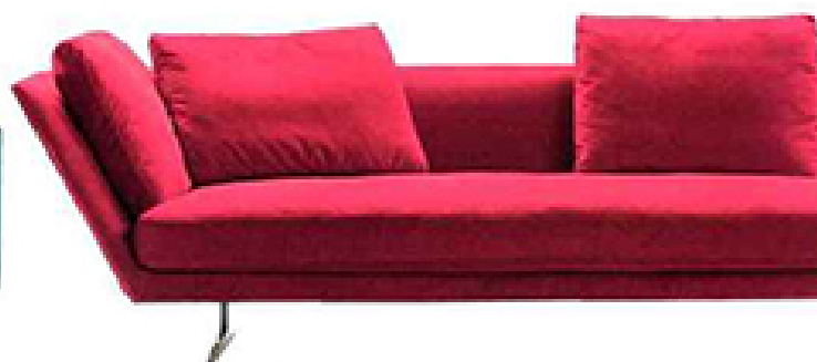
Zeus. Canapé en polyuréthane et mousse recouvert de tissu, pieds en alu chromé, L 246 x H 68 x P 90 cm, à partir de 6 835 €, design Antonio Citterio, Flexform.