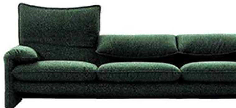
Maralunga. Canapé avec appui-tête à deux positions, Compasso d'Oro dans les années 1970, L 238 x H 73/100 x P 95 cm à partir de 6 400 €, collection | Contemporanei, Cassina.