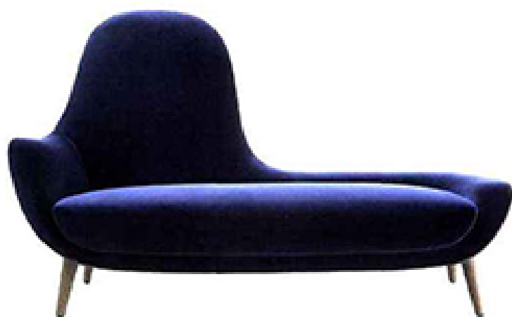
Mad. Chaise longue habillée de velours bleu, pieds en chêne massif, L 183 x H 106 x P 91 cm, prix sur demande, design Marcel Wanders pour Poliform.