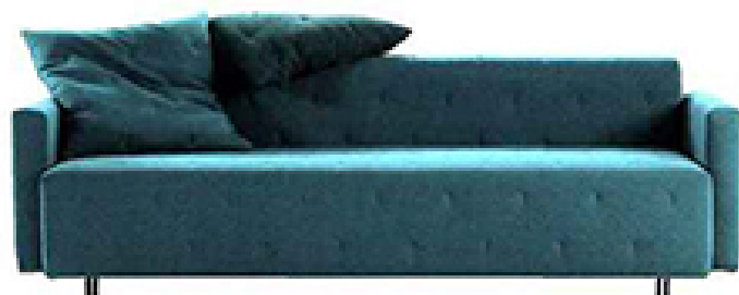
Map. Canapé convertible/couchage 140 cm, rangement couette et oreillers, L 221 x H 95 x P 95 cm, design Rafa Garcia, à partir de 1 578 €, Made in Design.