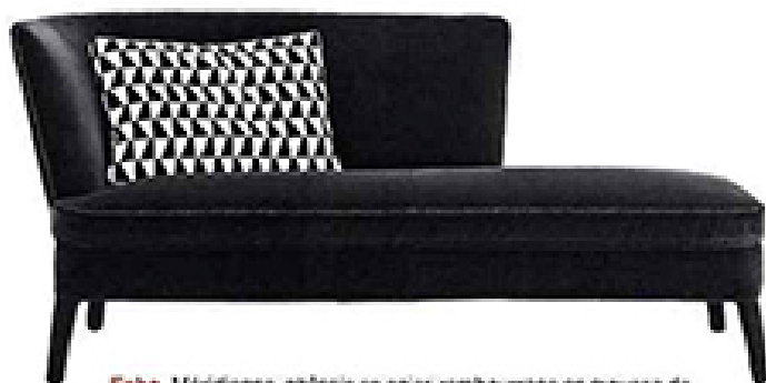
Febo. Méridienne, châssis en acier, rembourrage en mousse de polyuréthane, revêtement velours avec coutures à point cavalier, L 174 x H 41 cm x P 96 cm, à partir de 3 916 €, Maxalto.